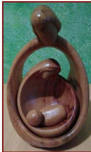
Svatá rodina z olivového dřeva z Assisi (přivezená v říjnu 2019 z duchovní pouti po stopách sv. Františka