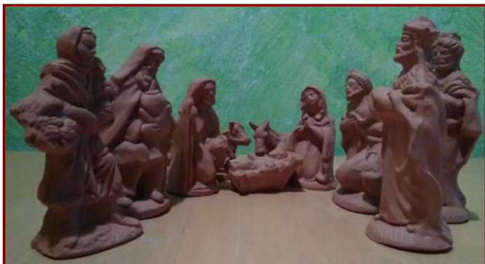
Terakotový betlém z Greccia (přivezený v říjnu 2019 z duchovní pouti po stopách sv. Františka)